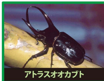
アトラスオオカブト