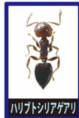
ハリトシアゲアリ