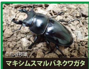
マキシムスマルバネクワガタ