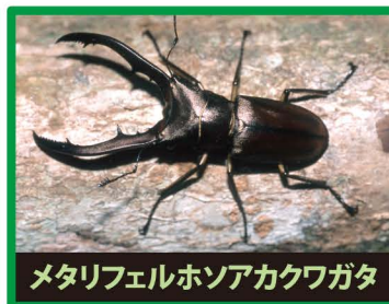
メタリフェルホソアカクワガタ

野外に出ると、日本のカブトムシやクワガタの餌やすみかをうばったり、交雑したり、昆虫の病気を広めたりします。