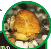
かんしょう用の ゴールデンアップルスネール

つかまえても、他の場所に持って行かないでね。 飼っている貝は、池や川に放さないでね。