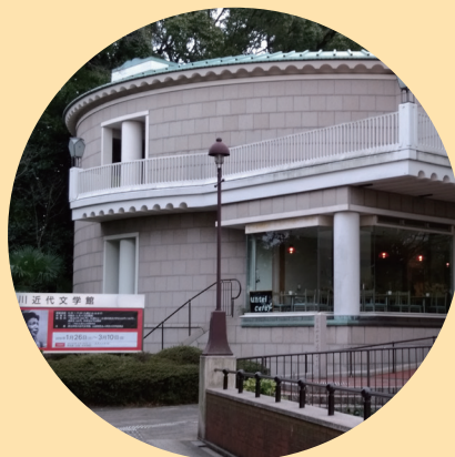
神奈川近代文学館