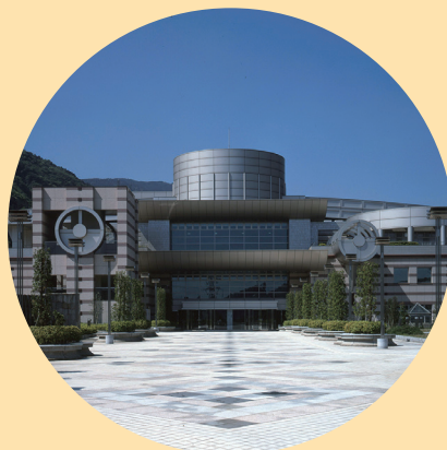
生命の星・地球博物館