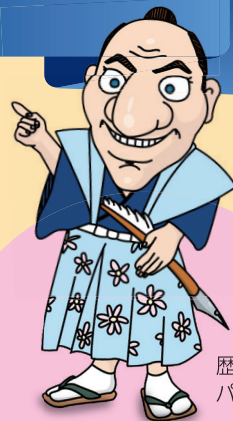
歴史博物館 パンチの守

オープン・コミュニケーション・デーでは みんなで自由にオシャレしながら 博物館や美術館を観覧できるのじゃ! ワタシも参加するのじゃ! みんなをまっているぞ!