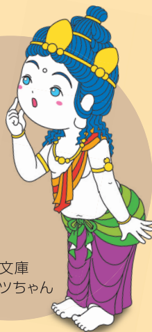
金沢文庫 ボサツちゃん