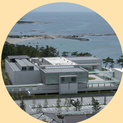
近代美術館 葉山館

オープン・コミュニケーション・デーでは みんなで自由にオシャレしながら 博物館や美術館を観覧できるのじゃ! ワタシも参加するのじゃ! みんなをまっているぞ!