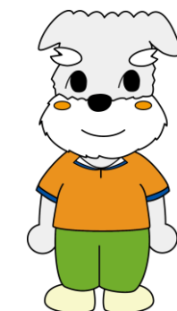
高齢センターキャラクター ケンケン

※受講の可否に関わらず、結果は郵送にて通知いたします。7月21日（金）までに通知が届かない場合（締切日時以降の申込みは、申込後1週間以内に通知が届かない場合）は、下記へご連絡ください。