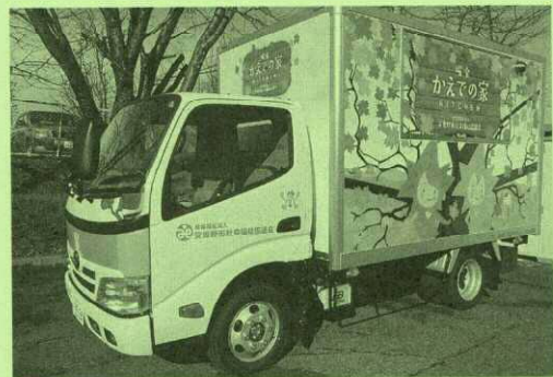
(社福) 安曇野市社会福祉協議会 長野県 堀金かえでの家 移動販売車