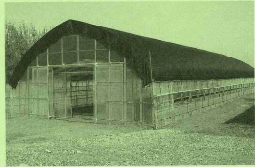
(社福) 真宗協会 北海道 帯広慈光学園 ビニールハウス