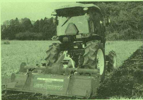
(社福) 愛信会 茨城県 第二幸の実園 トラクター耕運機