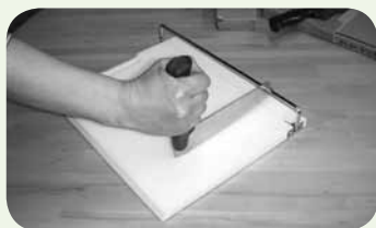
使いやすい 包丁や器

でも使いやすい工夫がしてあります。隣には陶芸や手芸、絵画などの趣味の創作活動に利用できるスペースがあります。親子で参加できるプログラムも開催しています。