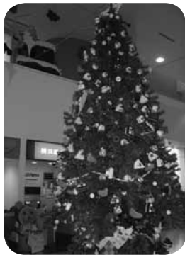
12月は外来ホールに大きなツリーを飾りました