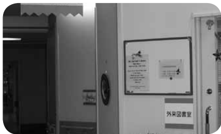
外来図書室入口。小児医療関係の図書や児童書などの閲覧、DVDの視聴、学習などができます。ボランティアがいるので安心