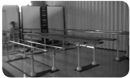
理学療法 (PT) や作業療法 (OT)、言語療法 (ST) など専門スタッフも

A：一般に地域の保健センターで受ける乳幼児健診が障害発見の窓口となります。リスクが見つかったらすぐに関わるべきというのが早期療育の考え方ですので、健診で気がかりが見つかったらすぐに地域の病院へ紹介するというのが通常になります。とはいえ障害の種類は