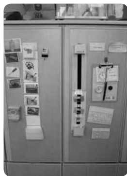
同じ時間割でもその子に合った示し方をしています

知的障害部門の小学部の教室ではちょっと目を引く個人用ロッカーを発見。ロッカーの扉になにやら貼ってあるのは1人ずつのその日の時間割。それぞれの子どもが理解しやすいように、写真で時間ごとの活動場所を示してあったり、「こくご」「おながく」と教科が文字で表された時間割も。「小学校に入学するときに、療育センターでの子どもの体験と小学校の生活が大きく変わってしまわないように、療育センターと連携をとって、センターでの子どものやり方を小学部でも取り入れるようにしています」。小学部入学という大きな変化に戸惑う子どもに、一人ひとりのことを考えた教育がされているのだと感じました。