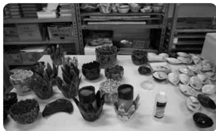
陶芸実習室には個性的な陶芸作品

養護学校特別プログラムにより、週に1回講師を招き、フルートやヴァイオリン等の演奏に取り組んでいます。「卒業記念コンサート」など年数回のコンサートも開いているそうです。「自立支援コース」には農園芸班、手工芸班、調理班、木工班の4班