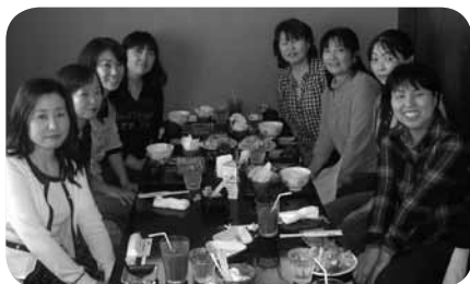
おおきな木を立ち上げたお母さんたち

ポートしてもらうことができました。こうして見つけた物件はマンションの集会室の一室でした。しかし賃貸費用や備品の購入など事業開始には多くのお金が必要になります。資金について鍛冶さんたちは民間の助成団体を調べ、申請したところ、審査に合格。自分たちの計画に理解を得ることができ、助成金を受けることができました。