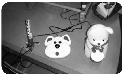
肘や額で押せるスイッチ