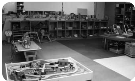
若いお母さんが先輩のお母さんに相談している風景もよく見かけます

オープン当初は木のおもちゃを集めていましたが、今は市販されているおもちゃが大半を占めています。それは経験を重ねていくなかで、気づいたことがあったため。例えば手しか動かせないといった障害のある子どもは、スイッチを押せば音が出るとか光るとか、そういったアクションがあるものを好んだりするのです。ボランティアを中心に、市販のおもちゃに手作りのスイッチをつけ足したりしてくれています。ちょっとした工夫で、子どもが楽しく遊べます。