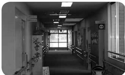
訓練室などは廊下から靴を脱ぐエリアに。落ち着いて取り組みます

A：地域の支援を受けるとはいえ、障害児との暮らしにはさまざまな困難があるものです。総合療育相談センターは有床診療所を併設していることから、在宅障害児の方にもさまざまなメリットを提供できます。まず外来では、経験豊富な医師、看護師、心理職、療法士、ケースワーカーのスタッフがチームを組んでそれぞれの障害に合わせた療育を組み立てます。このチームには診察・外科的治療(手術)・訓練を受けることはもちろん、地域生活でのさまざまな事柄を相談することが可能です。例えば、入園が決まった場合に保育士などへの療育的アドバイスなどを聞いておけば、集団生活がスムーズにすすむでしょう。家庭内の設備や道具についてももちろん専門的なアドバイスが受けられます。また、外来受診児を中心にお声がけして、幼児を対象とした母子グループ活動も展開しています。集団活動を経験することはもちろん、お母さま同士の交流の場としても好評をいただいているようです。最後に、病棟では主に地域で暮らす重症心身障害児、肢体不自由児を対象として短期入所を受け入れており、緊急時の利用も可能です。地域で孤立することなくその子なりの生活を送るために、総合療育相談センターの専門性と経験がきつと役に立つはずです。