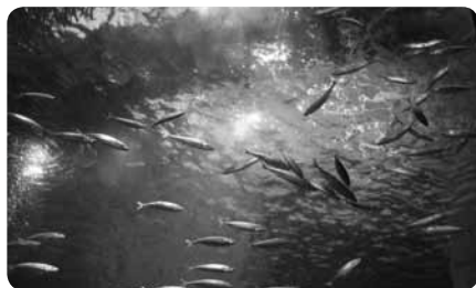
幻想的な魚たちの舞

センターハウスには救護センターや迷子センターがあるほか、車椅子やベビーカーの貸出しも行っています。さらに赤ちゃん以外のおむつの交換や休憩する場所として介護スペースを設けています。