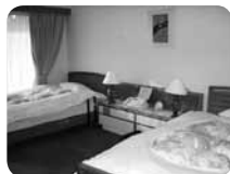
洋室には段差がなく、トイレも車椅子用の広い作り