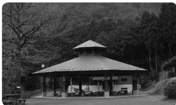
段差のないキャンプ場でテント泊やデイキャンプを。雨天の焚き火もOK