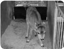
こどもの国牧場には、かわいい動物がたくさん！