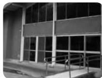
ロッジ裏にスロープが付設されており、バリアフリー対応可能