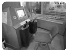
運転シミュレーターは大人気