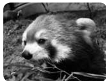
レッサーパンダはかわいくて人気者