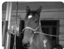
根岸競馬記念公苑では引退した競走馬とのふれあいも楽しめます