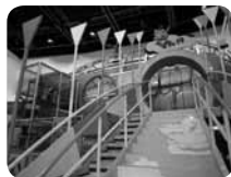
体を使って遊べるこどもファンタジー展示室