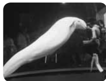
ドルフィンファンタジーではシロイルカがお出迎え