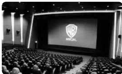
車椅子のままでもゆったり鑑賞できます

各館にサービス介助士2級の資格を持つスタッフがいますので、困ったときにはすぐに声をかけて相談でき安心です。耳の不自由な方にはヘッドホン型の補助具ヒアリング・ガイドの貸出しもあります。駐車場から映画館まで含めて施設はバリアフリーです。