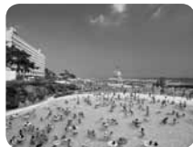
多彩なプールが楽しい大磯ロングビーチ