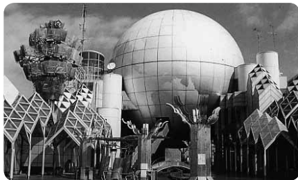
不思議なオブジェやからくり時計が立つ建物外周も楽しめます

宇宙や天文に興味があったお子さまは2階ホールへ。子ども向けプログラムの投影があるプラネタリウムとあわせて楽しむことができます。土日には障害のある子どもも参加可能な工作や陶芸などのワークショップを開催。興味があればぜひご相談を。