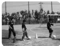
サッカークラブVientos は月2回活動