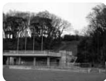
人工芝ゲレンデを滑降! 爽快感がたまらないそりゲレンデ