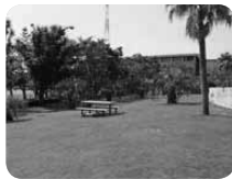
広い芝生広場では夏になるとウクレレやフラのイベントも