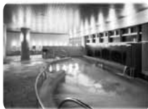
温泉は北海道長万部二股温泉産出の炭酸カルシウム人工温泉