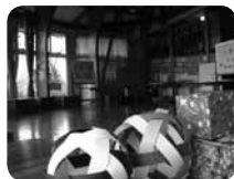
手作りおもちゃで遊べる子どもの館。2階にからくり人形展示も