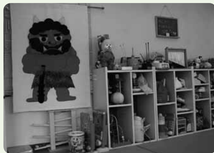
たくさんあるから、夢中になれるお気に入りが見つかる (のこのこ)