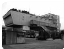
船形の建物の愛称はワンダーシップ