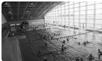
25m プールには歩行専用レーンがあります

月1回、第2日曜の朝から夕方まで館内でフリーマーケットを開催。出店数はそれほど多くありませんが、ちょっと珍しいものを手にできるかも。