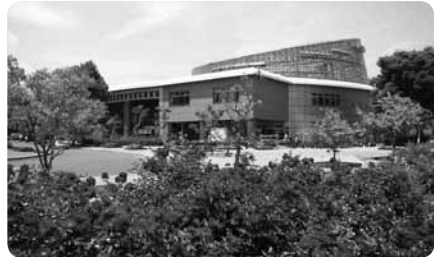
マンゴーなど、身近な果物も見つかるトロピカルドーム

隣接したごみ焼却施設の余熱を利用した温室・トロピカルドームはまるでジャングル。一年を通じて鮮やかな花々や身近な果物など、熱帯の植物を楽しめます。ちびっこたちのお気に入りにはアルカディア広場に設置された噴水。夏にはここで水遊びも楽しめます。