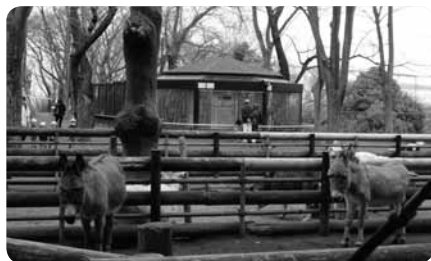
木もれ日のなか動物たちはすぐそばに

障害者用トイレは園内3か所があり、平日は鍵がかかっているため管理事務所から鍵を借りて使用します。車椅子使用の方、歩行が困難な方は駐車できるので管理事務所まで車で行って説明を受けてください。