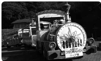
車椅子乗車も可能なフラワートレインは障害者手帳提示で半額に

園内散策に疲れたら、季節のハーブをブレンドした足湯処「湯足里(ゆったり)」にも無料で入浴できます。地魚料理が人気の和食レストランとそば処もあるので、家族で一日ゆっくりのんびり過ごしてみてもいいですね。