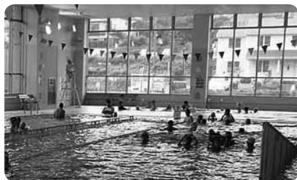
25mプールは5コース。入替制なし、休憩時間あり

北部公園にはプールのほかにも広場や、水路に水車が回る水の広場も。プールは入場料も手ごろで一日楽しめるから、気軽に立ち寄りたい公園です。