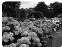
四季折々の色鮮やかな花々

園芸用植物を中心に、5000 品種の植物を間近に見ることができます。国内でもここにしかない“大船系”と呼ばれるしゃくやくやはなしょうぶをはじめ、ばら園やぼたん園などがコンパクトにまとまっています。飲食物の持ち込みが自由なので、芝生広場ではたくさんの家族連れがピクニックを楽しんでいます。自転車や車の乗り入れ、アルコール類の持ち込み、ペット連れ、球技などを禁止しているので、安全な環境でくつろぐことができます。安全・安心面から、近年子育てサークルの利用が増えています。夏休みには自由研究のネタ作りのためのサマーキッズプログラムを、また週末を中心に園芸教室を開催しています。