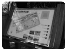
園内ガイドには点字と音声案内も