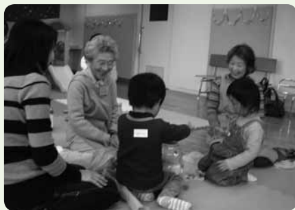
障害の有無や世代なども超えて、地域交流を持てるのも魅力（おなり）