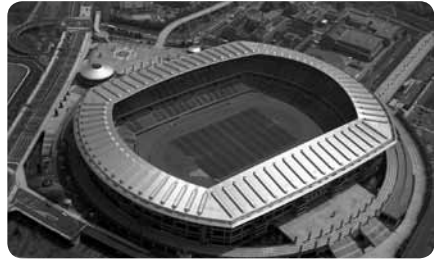
日産スタジアムを含む新横浜公園は横浜市最大の運動公園

スタジアム内には日産ウォーターパークや横浜市スポーツ医科学センター、レストランやショップなどの施設があります。またマリノス戦の開催時のみコンコース内に赤ちゃん休憩室が設けられます。また、フリーマーケットやワールドカップスタジアムツアーなど、魅力的なイベントも盛りだくさん！