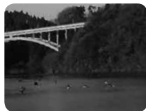
カヌーのご利用についてはお問い合わせください