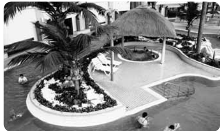
おとなにも子どもにも大人気の流水プール

72畳の大広間では持ち込みでの飲食もOKでくつろげます。大浴場・大広間からの眺望は横浜ベイブリッジに鶴見つばさ橋、京浜工業地帯と絶景。レストラン、温室もあって、いろいろな楽しみ方ができ、一日楽しめるところが魅力です。館内・駐車場ともにバリアフリーです。