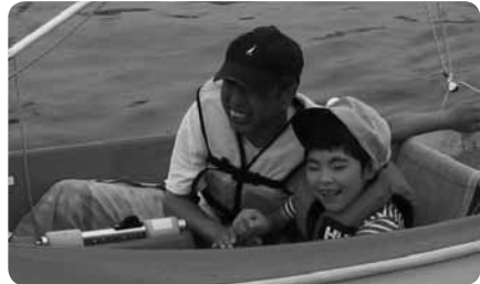
風を受けて楽しいセーリング

体験乗船ではインストラクターがていねいに乗り方を指導、およそ30分のセーリングにはスキッパー（船長）が同乗します。身体を動かしてバランスをとる必要もなく、初めて乗る人でも簡単に操縦できます。