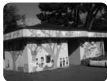
障害者用トイレはろう学校生徒によるペイントが目印