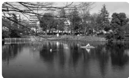
コブハクチョウのほかにもカモやカメ、コイなどの人気者が

子どもたちに人気の交通公園では市街地を模して信号や踏切を設けた道路で、自転車やゴーカートを走らせることが可能。蒸気機関車D52の展示もあります。最寄り駅から徒歩3分でアクセスもよく、立ち寄りやすい公園です。