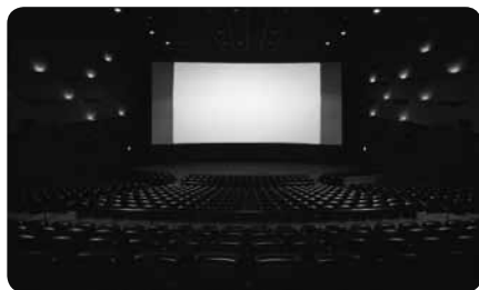
ハリウッド超大作やTOHOシネマズ限定のLIVE映像などを上映