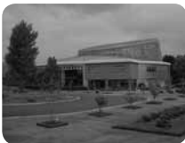
梅のほかにもバラや花菖蒲など、一年を通じて花を楽しめます