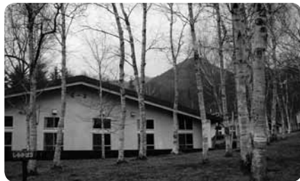
白樺林の中にたたずむロッジ「しらかば棟」は宿泊定員50名

さらに、学生ボランティアをはじめとするたくさんのサポートで、安全に、安心して野外での活動プログラムを楽しむことができます。今年度は秋にデイキャンプの形で実施の予定。詳細は開催時期が近づいたら県広報やチラシ、HPをご参照のうえ、電話でお申し込みください。