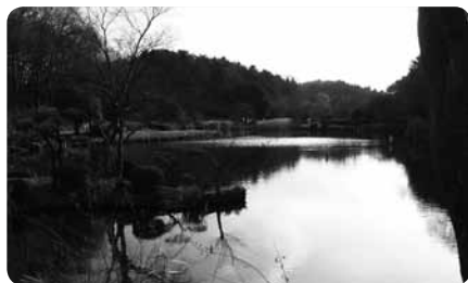
園内で一番大きな“大池”

そのほかにもピクニックやバーベキューができる広場、散策にもってこいの草地など、家族で、お友達同士で、一日中楽しめる公園です。季節ごとにイベントを開催、とくに毎年7月末の旭ジャズまつりは盛況です。