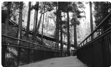
急な斜面をつづら折りで登る根小屋周遊園路はバリアフリー

北西麓の花の苑地には簡単な食事ができるおそば屋さんも。津久井湖をはさんだ水の苑地とともに、四季を通してさまざまな花が楽しめるのも魅力です。深い森林で新鮮な空気を胸いっぱい吸い込んで、体も心もリフレッシュしてみては？