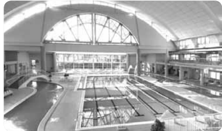
きれいな水と充実の設備で大人も子どもも大満足

障害のある方は男女を問わず同伴者と一緒に入れる障害者用更衣室も利用可能。お父さんと女の子、お母さんと男の子といった異性での組み合わせでも気兼ねなくプールに入ることができます。入館時にハンディキャップがあることを示すカードを配布されるので、これをプールに入る前に現場の監視員に提示することで遊泳の安全を見守ってもらえます。充実の施設で気軽に水中運動にチャレンジしてみては？