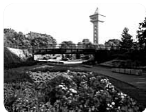
季節の花々がお出迎え。 奥にはグリーンタワー相模原が