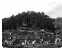
春には満開の桜に囲まれる小田原城アドベンチャー