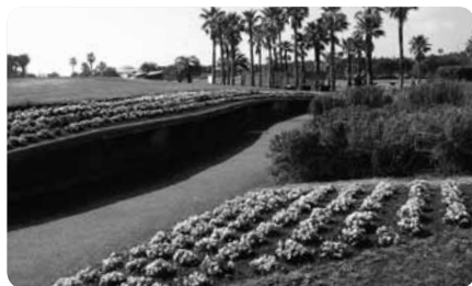
段差のない「人にやさしい」園内。車椅子で楽しめる花壇も

さらに、湘南工科大学教授の協力のもと園内の池やプールで春と秋に実施される「ユニバーサルカヌー体験会」では、高齢者や障害者など誰でも安全に楽しめる癒しのカヌーが体験可能。水面に漕ぎ出す快感をぜひ体験してください。