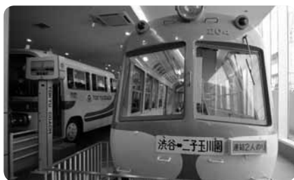
本物の電車やバスに大興奮

年6回のイベントや地域と連携した催しなど楽しめる企画が毎月のようにあります。当日は出入り自由なので思う存分遊べます。