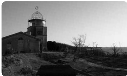
相模湾を眺めることができる展望台はエレベーター付き

さらに、キッズガーデンでは芝そり、グレンデやゴーカート、おもしろ自転車などでたっぷり遊ぶことができます。三方に海も見え、雰囲気たっぷりの園内を散策するだけでも楽しいソレイユの丘。西側の海に面して「海と夕日の湯」という開放感たっぷりの温浴施設もあるので、一日遊んだら最後にお風呂に入ってから帰っても。