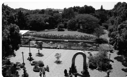
スロープで入園でき、道も広くて段差が少ない園内