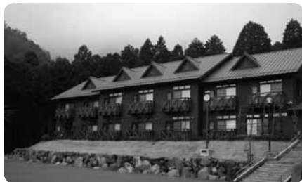
研修棟や活動棟では間伐材などを利用したチップボイラーで暖房や給湯を

また、活動棟の調理室だけでなくキャンプ場にも車椅子対応調理台を完備。なかなか経験できない野外炊事の楽しさを味わうこともできます。丹沢大山国定公園のなか、標高約400mに位置するセンターからは、天気の良い日には伊豆大島まで望めるとか。宿泊にデイキャンプに、家族やグループで活用したい施設です。