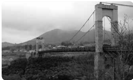
公園のシンボル「風の吊り橋」が丹沢の山並みに映えます

また、ちょっとひと休みしたくなったら、茶室でお抹茶をいただくこともできます。一日たっぷり遊んでリフレッシュできる公園です。