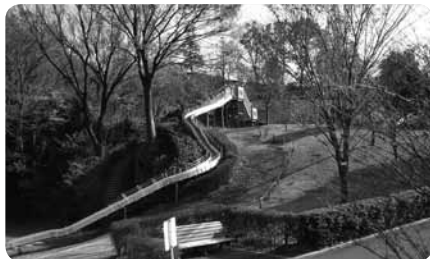
丘の斜面を利用したローラーすべり台は全部で3本

また、公園中央部に位置する丘にのぼれば丹沢山系の素晴らしい眺望が広がり気分も爽快。さらに丘の上には夏には水遊びができる池やアスレチックなどもあり、たっぷり遊べます。コースを選べば車椅子やバギーでも丘の上までアクセスできるので、ぜひ一度お試しください。