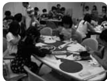
小学校低学年向けのアトム工房科学実験教室はいつもにぎやか