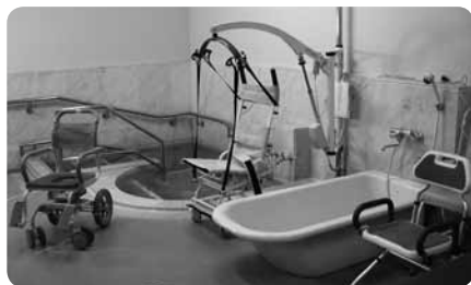
鍵のかかる小浴室（家族風呂）には2タイプあり、その1つにはリフトを設置

また、肢体・視覚・聴覚等、それぞれの障害に合わせた、設備や備品もそろっています（詳細については直接お問い合わせください）。あゆみ荘の食事の最大の特徴はミキサー食。ひと口大から刻み、より細かいミキサー食まで対応しています。夕食は部屋食、朝食はレストランでどうぞ。