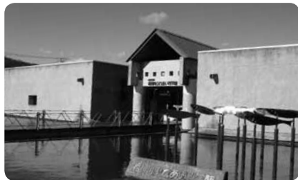
科学館前の水盤は、夏には水遊びの子どもたちでいっぱい

一般的な水族館ではなかなか目にかけられない相模川流域のいきものを集めた展示が相模川ふれあい科学館の一番の魅力です。なかでも113kmある相模川の様子を40mの水槽に凝縮した流れのアクアリウムは見てたえ十分。相模川を上流・中流・下流・河口と4つの流域に分け、それぞれに生息している動植物を展示しています。さらに、特別天然記念物・オオサンショウウオや、天然記念物のミヤコタナゴを含む各種タナゴを集めたタナゴ水槽なども興味深い展示。屋外のタッチング池では、水辺の小動物に直接手を触れて確かめることができます。このタッチング池や流れのアクアリウムはバリアフリーにも配慮した構造。お魚好きのお子さまにおすすめのスポットです。