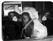
牛の乳しぼりや野菜・果物の収穫などさまざまな体験にトライ