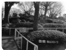
ちょっとした築山なのに登ってみると不思議な爽快感!