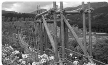
揺れるつり橋は床板に隙間もあってさらにスリル満点（車椅子利用可）

ほかにも、ヒツジやヤギにエサをやったり、ポニーに乗ったりできる「ふれあい広場」や、夏には「カブトムシの家」と水遊びが楽しめる「うなぎ沢」、全長67mの揺れるつり橋・わんぱく大橋など、お楽しみがたくさん。園内には6か所の共用多目的トイレがあり、管理棟では授乳室やお湯の準備も。雄大な自然を安心して遊びつくせる公園です。