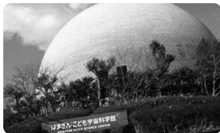
電車も車も好アクセス。宇宙劇場の大きな丸いドームが目印