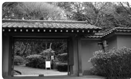
南門をくぐると緑のトンネルに縁取られた園路がつづきます

園内には郷土資料館や抹茶をいただける茶室、「ひかりの広場」「ふれあい広場」など、安全に屋外での遊びを楽しめる広場も。展望台からは富士山や箱根山、相模湾も望むことができ、四季折々の花との出会いも楽しみです。三井邸時代の面影を探しながら、ご家族そろってゆったりと時間を過ごしてみたいいかがでしょうか？