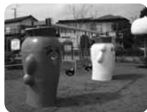
にんじんと大根が支える ブランコは幼児用パケッ トタイプで安心