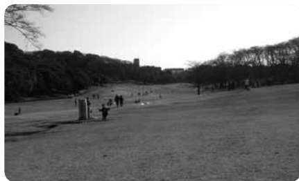
腰を下ろしたり、寝転んだり……広い芝生を思い思いに楽しんで

また、根岸競馬記念公苑が併設されていて、馬の博物館やポニーセンターなどの施設を楽しむことも可能。ポニーセンターでは週末に馬にエサをやったり、乗馬をしたりといった体験も。なにより、広い芝生に腰を下ろして、家族でのんびり過ごしたい、穏やかな時間の流れる公園です。