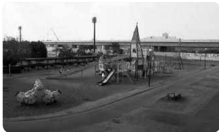
利用者や保育士さん、地元小学生などの意見を導入した大型遊具も

さらに、野球場の裏手には予約制の野外炉が5基設置されたバーベキュー場も。芝生に囲まれた野外炉でアウトドアランチを楽しむこともできます。また、大小の体育室やトレーニングルームなどがある総合体育館には幼児室も。家族で体を動かして楽しめる公園となっています。