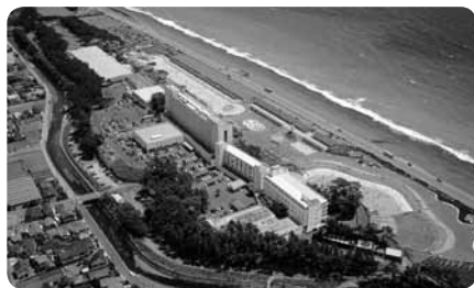
目前が海! どこまでも続く水平線を眺めながら癒しの休日

夏季営業の屋外プール施設・大磯ロングビーチには楽しさあふれる9種のプールがあります。ゴムボートに乗って15分ほどの流れるプール一周を楽しむもよし、水深0.6mまでに限定された波のプールの子どもゾーンで渚気分を満喫するもよし。楽しい休日を過ごせます。