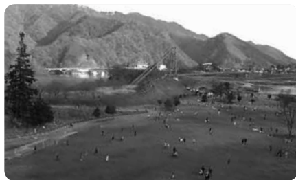
山と湖に囲まれた好環境で、さまざまな自然に出会えます

どちらのエリアでも人気が高いのが湖を周遊できる遊覧船。さらに、広い敷地内の移動にも便利なロードトレインもちびっこたちに人気です。広い敷地ながら階段にはエレベーターやスロープが付設されるなど配慮は十分となっています。