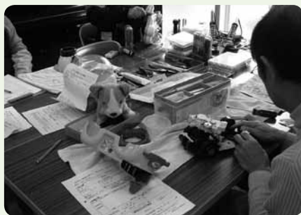
おもちゃ病院併設の図書館ではおもちゃの修理(費用実費)も(たんだん)