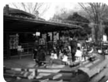
動物たちとの ふれあいの場