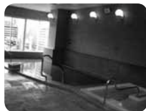
奇数日と偶数日で男女の入れ替えを行い、2種の風呂を楽しめます