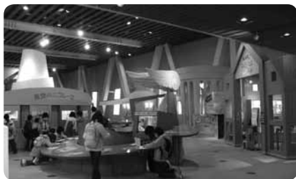
エコドライブを体験できる展示「青空のエコレース」は大人気

ほかにも本・ビデオがそろった環境情報センター、屋上にはビオトープがあります。週末に人気なのはさまざまな実験・工作ができるワークショップ。年5回のイベントは家族で楽しめます。見晴らしのよい6階休憩室では飲食OK。おむつ替えの場所も考慮されていて、館内随所でスタッフが細やかに対応してくれます。