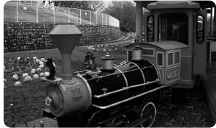
園内のミニSLがおもしろい！

園内は、車椅子の方でも通れるゆるやかな道が多くスロープの道が記載されたわかりやすい地図もあるのでとても便利。またトイレも障害者用トイレが園内に14か所あるのでとても安心です。1年を通して、フリーマーケット、工作教室、牧場の乳しぼりなどのイベントも盛りだくさん！ イベントはHPをチェックして出かけてみよう！