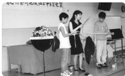
演目は手話マジックや手話落語など。最後は全員で手話合唱も

善意の助成金と個人の寄付金で成り立つこの催しは、なんと入場無料。必要な演目には通訳がついたり、太鼓などの演奏時には響きを振動から感じられるように風船が配布されたりと、聴覚障害のある人も障害のない人も一緒に楽しめる会となっています。2010年の開催は12月最初の日曜日。日本の伝統芸能・寄席の楽しさを実感してみてください。