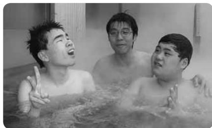
冬なら温泉やスキーに出かけましょう

長期休暇中は海水浴や山登り、宿泊プランなどのイベントも行っています。料金の目安は、週1回1時間程度の利用で平均月2～3万円。責任を持ち、安全を確保するということを大前提に、子どもたちの願いをかなえるため、日々活動しています。