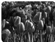
一年中どの季節に訪れても折々の花が迎えてくれます