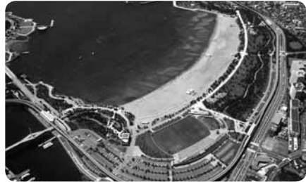
子どもからお年寄りまで自然と親しめる公園

一年を通して楽しめる公園です。春先から夏にかけては潮干狩、夏は海水浴、気候がよい時期なら、バーベキューにピクニック、ウィンドサーフィン、サッカーと何でもござれ。月1～2回開催のフリーマーケット、1月のどんどこ焼き、8月の花火大会やビーチバレー大会など、イベントも盛りだくさん。ウォーキングやジョギング、砂浜遊びは無料です。どんな人になってもシャワー室があるからへっちゃら。海の公園南口駅のそばには、リードなしでOKの犬のための遊び場まであります。潮干狩の採取量や道具など利用するうえでの決まり、公園をきれいに使うためのマナーなど、ルールを守って楽しく遊びましょう。