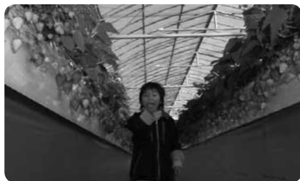
高設ハウスなら立ったまま、車椅子でもぱくっ（入園料100円増）

立ったままでもいちごを摘むことができる高設ハウスでは、車椅子の方もそのままいちご摘みが可能。あすカルビー、さちのか、紅ほっぺと多彩な品種を栽培しているので、1月から5月まで、長い期間旬のいちごを楽しむことができます。時期によって料金は異なりますが、ミルクをたっぷりつけて甘いいちごを食べ放題。おいしく、楽しく、甘い思い出づくりに、いちご狩りはいかがでしょう？