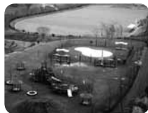
コンビネーション遊具とフワフワジャンプがある子どもの広場