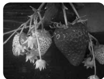
高設ハウスで栽培される紅ほっぺはやわらかくてフルーティ