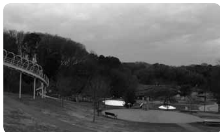
豊かな自然に囲まれた遊具スペースで思う存分楽しんで

元気いっぱいの子どもたちにはロングすべり台がある「風の谷」と遊具のある「風の広場」、夏には水遊びが楽しめる水深約30cmの「中ノ谷池」など、園内東側がおすすめ。シーズンにあわせて自然観察や水田作業などの体験イベントも。親子で楽しめる懐かしさいっぱいの公園です。