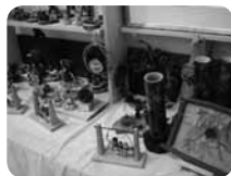
どんぐりやまつぼっくりなどを使った「里山クラフト教室」も