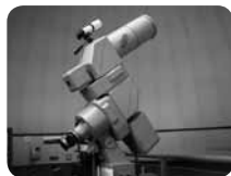
天体観測会以外にも、実験教室や工作教室などイベント多数