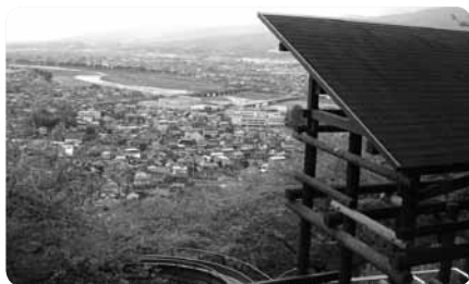
斜面に作られ、街並みを見下ろすすべり台は気分爽快！

立地上、急斜面や階段も多いのですが、子どもの館やハーブガーデンは車椅子でもアクセス可能。ぽっぽ鉄道乗り場までも段差はありません（急斜面あり）。ハーブガーデン3階には展望レストランもあり、一日遊べる公園です。