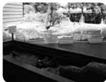
タッチング池にはスロープがあるから車椅子アクセスOK