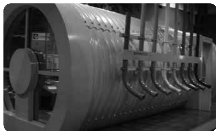
中で叫んだり手をたたいたり、音に反応するエコトンネル

プラネタリウムへの移動はスタッフに声をかけてエレベーターで。後方の見やすい位置にある車椅子用観覧席に案内してもらえます。また、ペントハウスの天体観測室までは、エレベーターと昇降リフト付き階段で。接眼レンズは固定したままで観測できるクーデ式天体望遠鏡だから、車椅子に座ったままでも月や星を見ることができます。