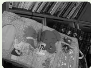
布えほんサークルによる布の絵本はおもちゃ図書館でも定番人気（平塚）

良質素材で安心・安全な布の絵本やおもちゃを作っているのが県内各所の「布えほんグループ」。そのやわらかな感触から心の発達を促すだけでなく、ボタン・スナップ・ひも・ファスナーなどを用いた楽しいしかけにより、手指の発達や自発性・自主性の発達を促すことも。一つひとつ愛情をこめていないに作られたアイテムには、市販品にはないぬくもりが。社会福祉協議会や図書館などを窓口にして貸出しを行っているのでぜひお問い合わせください。