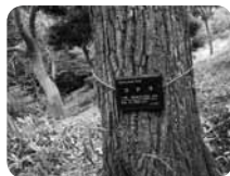
園内の植物には解説プレートが。知識欲も満たせます