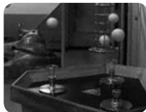
見るだけで楽しいストリームボールは空気力で浮き上がる

ほかにも見て、触って、楽しめるアトラクションが多くあるので、きっとお気に入りが見つかるはず。宇宙劇場は車椅子でも入れ、エレベーターもあるのでフロアの移動もらくらくです。