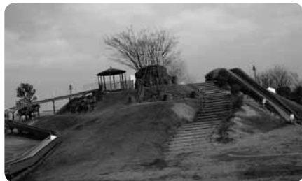
右からにんじんすべり台、冒険ネット、展望ローラー スライダー

公園内には温水プールもあり、カエルとキノコの噴水がある幼児プールも。更衣室や駐車場などに配慮があるので、障害のある子も気軽に利用できます。また、プール棟などに車椅子対応のトイレや授乳室もあります。夏には園内のじゃぶじゃぶ池で水遊びも楽しめます。テニスコートやジョギングコースもあり、お弁当や地場野菜を扱う売店も。家族で一日楽しめる公園です。