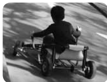
左右のバーで操作するスライダーサイクルも人気