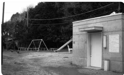
ブランコやすべり台などの遊具とトイレが備わっています

駅からの道のりは段差こそないもののかなりの急斜面。車椅子の方は介助なしでの訪問は難しいですが、ひとたび公園に着くと大磯の街並みを見下ろす相模湾の絶景をひとりじめにできる公園です。車椅子対応のトイレもあります。ここから羽白山の尾根沿いに湘南平まで続くハイキングコースもあるので、健脚さんにはおすすめ。湘南平は車でのアクセスも可能で駐車場も十分あるので、景色を楽しむならそちらへどうぞ。