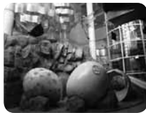
巨大なたまごにチョウ、トンボ……不思議な森の世界にはすべり台も