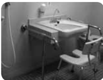
障害者用更衣室にはシャワー、トイレ、着替えスペースとロッカー完備