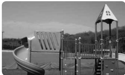
ひろびろとした園内でのびのびと遊べます。季節の花々も魅力

また、スロープが完備されているから、車椅子の方もグラウンドにらくらく下りられます。そりゲレンデは10時から16時まで(平日は12～13時休憩)、管理棟窓口で受付後30分交代制。そりやプロテクターは管理棟で貸し出します。安全のために必ず付き添いの方とご利用ください。