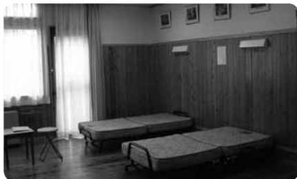
木の香りがただよう研修棟内の宿泊室。和室とベッドの洋室があります