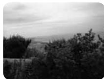
ひっそりと静かな公園でこんな素敵な景色を満喫