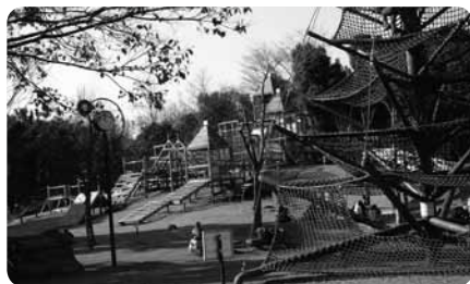
わんぱく広場にはいつも子どもたちの姿がいっぱい

園内にはポニー乗馬(有料)を楽しめるふれあい動物園もあり。エサやりを楽しんだり、小さな動物を抱っこしてみたり、普段できない動物とのふれあいで癒されること間違いなし。お弁当を持って行って一日たっぷり遊べる公園です。サッカーや野球の公式戦開催日には駐車場が混むのでご注意ください。