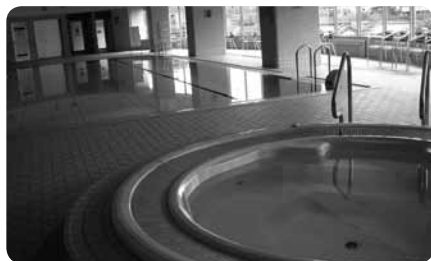
プールとジャグジーの周囲は床暖房完備。スペースもひろびろ

フロアまではエレベーターでのアクセス、フロアは段差をなくしてスペースもたっぷり、車椅子用のトイレなども完備されています。昼の休憩室では持ち込み飲食も可能で、ゆっくり過ごせます。