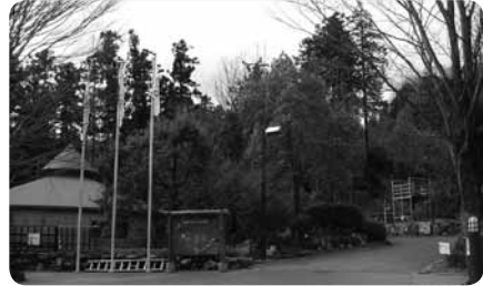
バリアフリー宿泊エリアへはゆるやかな舗装スロープで

毎年、障害のある子とその家族を対象としたバリアフリーキャンプを開催(2010年度は7月を予定)。プログラムではマスカミやキャンドルファイヤー、野外炊事などを楽しむことができます。