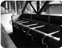
車椅子対応の炊事場でカレーなど野外料理を楽しんで