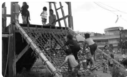
体を動かして思いっきり遊ぶよ

広い敷地の中にはどろんこになったり焚き火や水遊びをしたり、工具を使うこともできて自由に遊べる「冒険遊び場」と、建物の中には本を読んだりおしゃべりできる「ごろり」や楽器練習用スタジオ、屋根つきスポーツ広場などがあって、子どもが思いっきり遊べる場所です。なかでも「ゆるり」は乳幼児や障害児優先の部屋でおもちゃ・絵本などがあり、子どもを遊ばせながら大人も交流できる場です。これをしてはダメという看板はなく、少々汚れても大丈夫。大きめの声をだしてもOK! 夢パまつり、こどもゆめ横丁、野外コンサートなどイベントもいっぱい。施設内に売店・自販機はないのでお弁当などは持参してください。