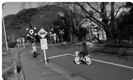
踏切前では一旦停止、できるかな？

また、いかサイクルやSLサイクルなど、ほかではなかなか乗ることのできないおもしろ自転車などもすべて無料で乗ることができます。乗り物好きならお気に入りになることまちがいないです。