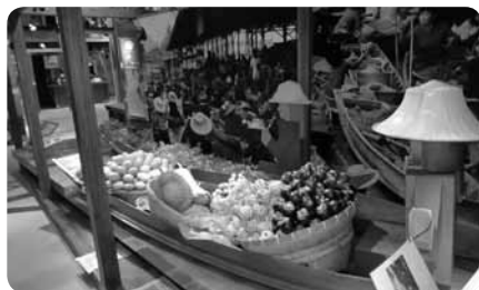
タイの水上マーケットも再現

展示室での幼児向けイベントのほか講座・イベント・映画会は多数開催されていて誰でも参加OK。地下駐車場も含め館内はバリアフリーで安心して楽しめます。