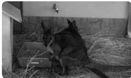
ふれあい動物広場の人気者・ダマワラビー。ほかにアライグマなども

さらに、高さ55mの展望塔・グリーンタワー相模原はこの公園のシンボリック存在。無料エレベーターで展望室に上ると晴れた日には丹沢、多摩丘陵、横浜、湘南の大パノラマが広がります。展望室から見下ろすと、園内には伝説の巨人「でいらぼっち」の足あとが。どこにあるか、ぜひ探しに行ってみて！