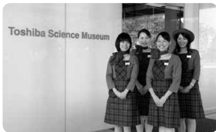
アテンダントが科学の世界をやさしく解説してくれます

おすすめ展示物を中心に見学したいなら、“アテンダント”と呼ばれる案内人のガイドツアーに参加してみてください。1階には車椅子対応のトイレやおむつ替えシート付きトイレを設置。また気分が悪くなったりした方のための救護室にはベッドが備え付けられています。授乳の方、おむつ替えなどにも利用できますので、スタッフに声をかけてください。