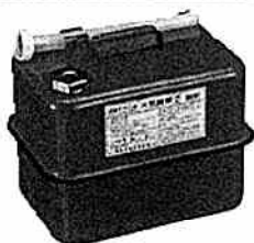
ガソリンの貯蔵に適した容器の例 (金属製容器であることが必要)