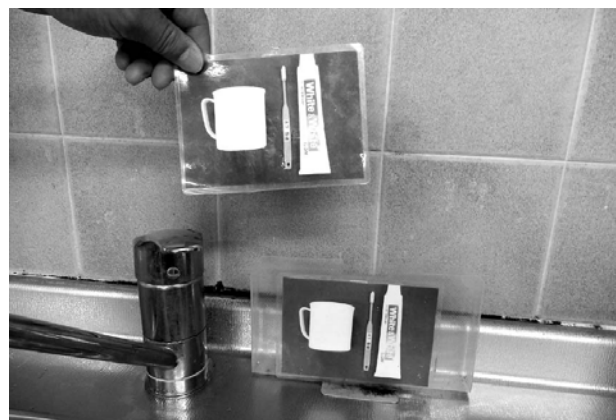
写真カードを使った手順と場所のマッチングの例