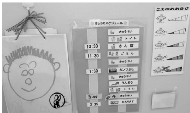
文字と絵によるスケジュール提示 声の大きさも視覚化

「いつ」「どこで」「なにを」という情報を、文字や絵、写真など、または実物等、一人ひとりの理解レベルに応じてスケジュールを提示します、また、提示の範囲も、1 日単位から半日単位、次の予定のみ等、利用者の理解度によって提示します。スケジュールの意味理解ができてくると、変化が苦手な人でも、予めスケジュールカードを差し替えることで混乱なく受け入れることができるようになります。このように本人が理解できるスケジュールを提示することで「見通し」を持ってもらうことができますようになります。