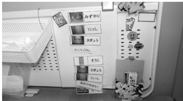
文字と写真によるスケジュール提示の例