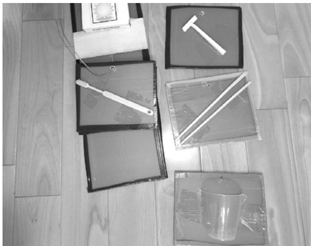
実物を使ったスケジュールの例