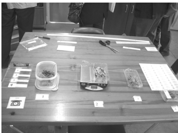
ハーブを計量機で計ってパッキングする作業の手順の提示