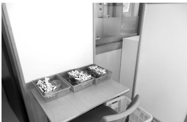
パーテーションを使った境界線の例

また、一つの場所を多目的に使用すると混乱しますので、例えば、作業をするところはワークエリア、おやつはフードエリア、遊びはプレイエリアというように場所と活動を一致させると利用者にとってわかりやすくなります。