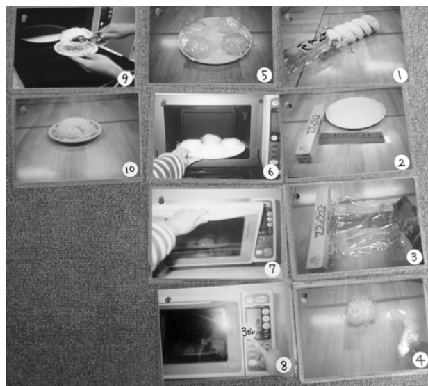
写真を手掛かりにした肉まんを電子レンジで調理する手順書

課題で扱う材料の組み立て方等について、手順書、指示書によって「どのように」をわかりやすく、視覚的に伝えます。プラモデルの設計図に当たるようなものです。また、サボタージュ場面（例えば、あえて材料の一部を抜いておくこと）により、適切な要求の方法を支援することもできます。