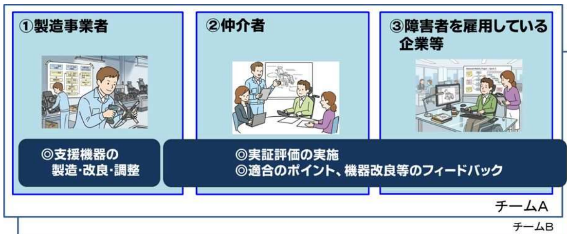
図：応募に係る評価チームの体制