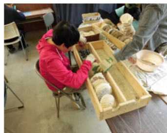
【カキ天然採苗用コレクター作製作業の様子】