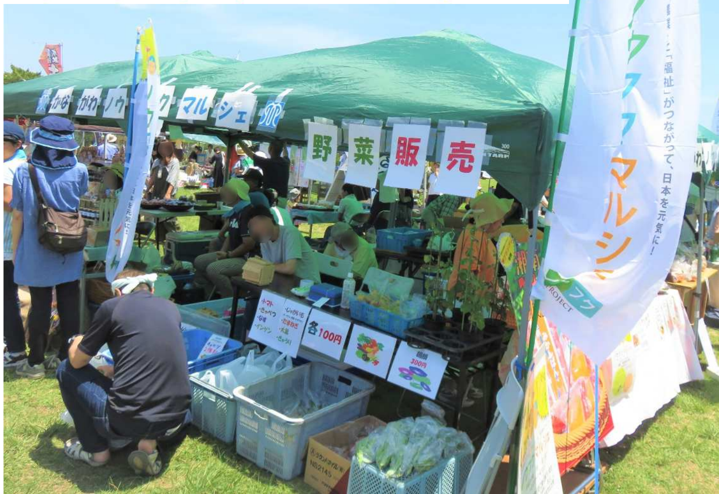
(↑H30年度に実施したかながわノウフクマルシェの様子)