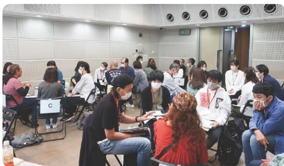
福祉施設の事例紹介をもとに、参加者同士が交流する講座