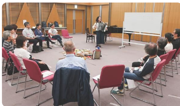
音楽ワークショップを体験する講座