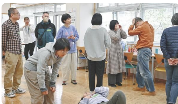
精神障害のある人との演劇の取組み