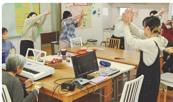
精神障害のある人との音楽の取組み