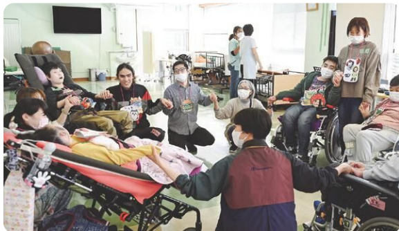
重度重複障害のある人とのダンスの取組み