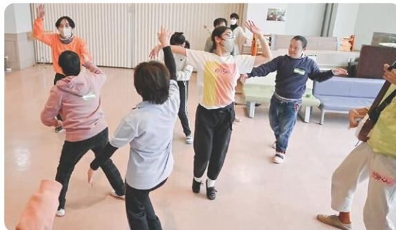
知的障害のある人とのダンスの取組み