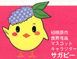
相模原市 食育推進 マスコット キャラクター サガビー

今年は健康フェスタ内にガチャガチャ初登場 スタンプラリーに参加してガチャを回そう！（小学生以下限定）