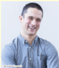
指揮・監修 ベン・セラーズ (ドレイク・ミュージック)