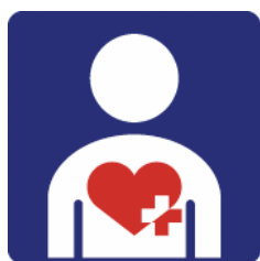
【ハート・プラスマーク】 所管：特定非営利活動法人ハート・プラスの会