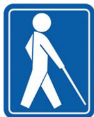
【盲人のための国際シンボルマーク】 所管：社会福祉法人日本盲人福祉委員会