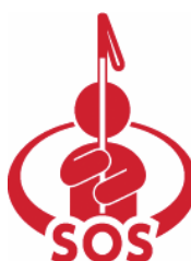
【「白杖 SOS シグナル」普及啓発シンボルマーク】 所管：岐阜市