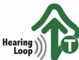
【ヒアリングループマーク】 所管：一般社団法人全日本難聴者・中途失聴者団体連合会