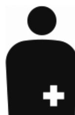
【オストメイト用設備／オストメイト】 所管：公益財団法人交通エコロジー・モビリティ財団