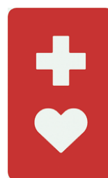
【ヘルプマーク】 所管：東京都