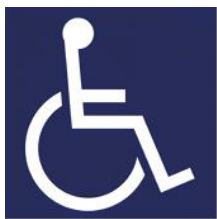
【障害者のための国際シンボルマーク】 所管：公益財団法人日本障害者リハビリテーション協会