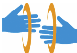
【手話マーク】 所管：一般財団法人全日本ろうあ連盟