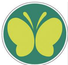
【聴覚障害者標識（聴覚障害者マーク）】 所管：警察庁