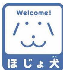
【ほじょ犬マーク】 所管：厚生労働省