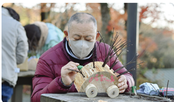
精神障がいのある人との美術の取組み