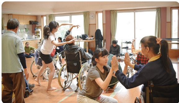
重度重複障がいのある人とのダンスの取組み