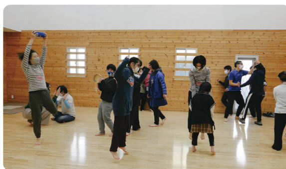
知的障がいのある人とのダンスの取組み