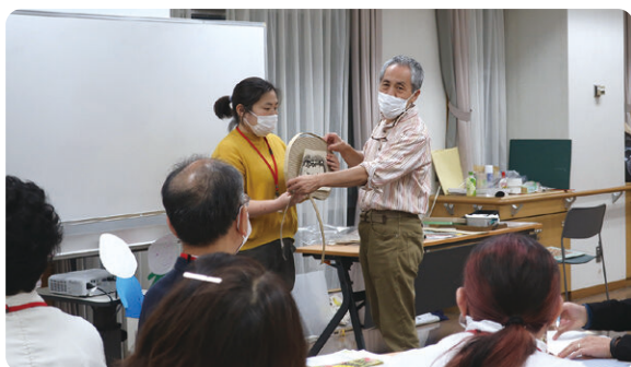
展示をテーマにした講座