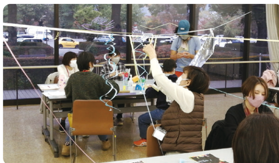
造形ワークショップを体験する講座