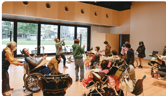
重度重複障がいのある人との音楽の取組み