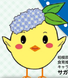
相模原市 食育推進マスコット キャラクター サガピー