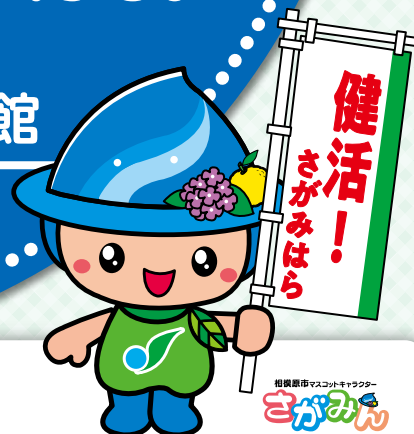
相模原市マスコットキャラクター さがみん