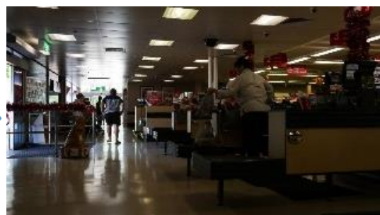
BGMのカット、一部の照明を消灯