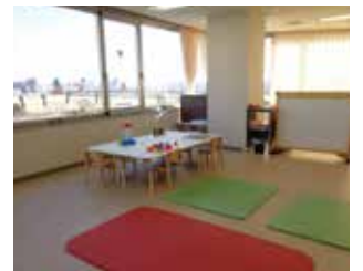
かもみーる さいわい