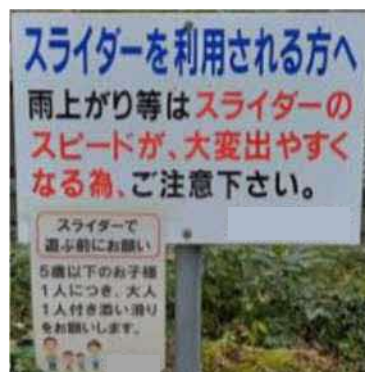
施設周辺の注意喚起状況