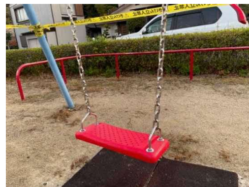
本格的な措置として座板等の交換を実施