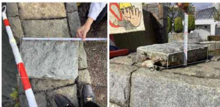
外れた修景用の石