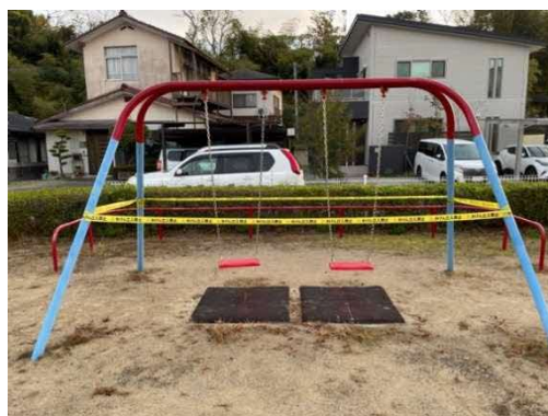
使用禁止後の本格的な措置状況