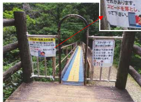
乗り口の注意喚起状況