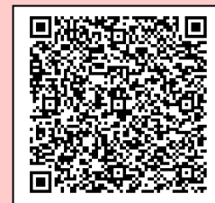
二次元バーコード

https://shinsei.city.yokohama.lg.jp/cu/141003/ea/residents/ procedures/apply/ffc3453f-5efc-4e9e-9892-cb53c9982bbe/start