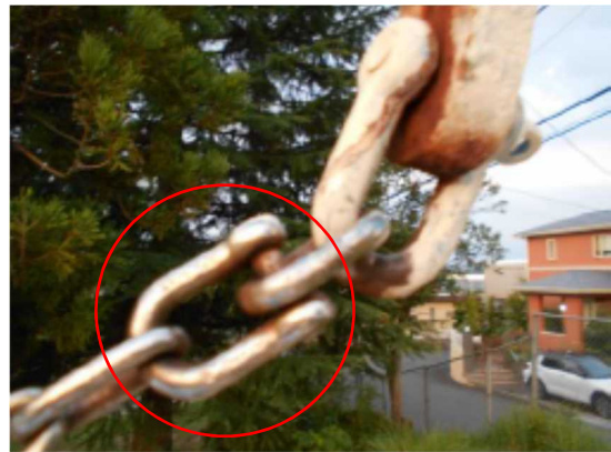
同形状のシャックルの使用状況