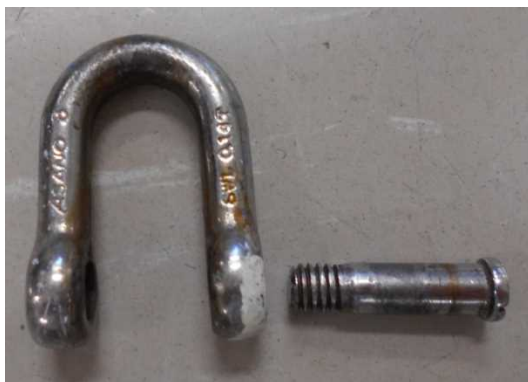
外れたシャックル