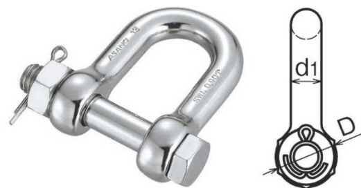
交換後の脱着防止シャックル