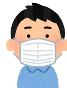
正しいマスク着用