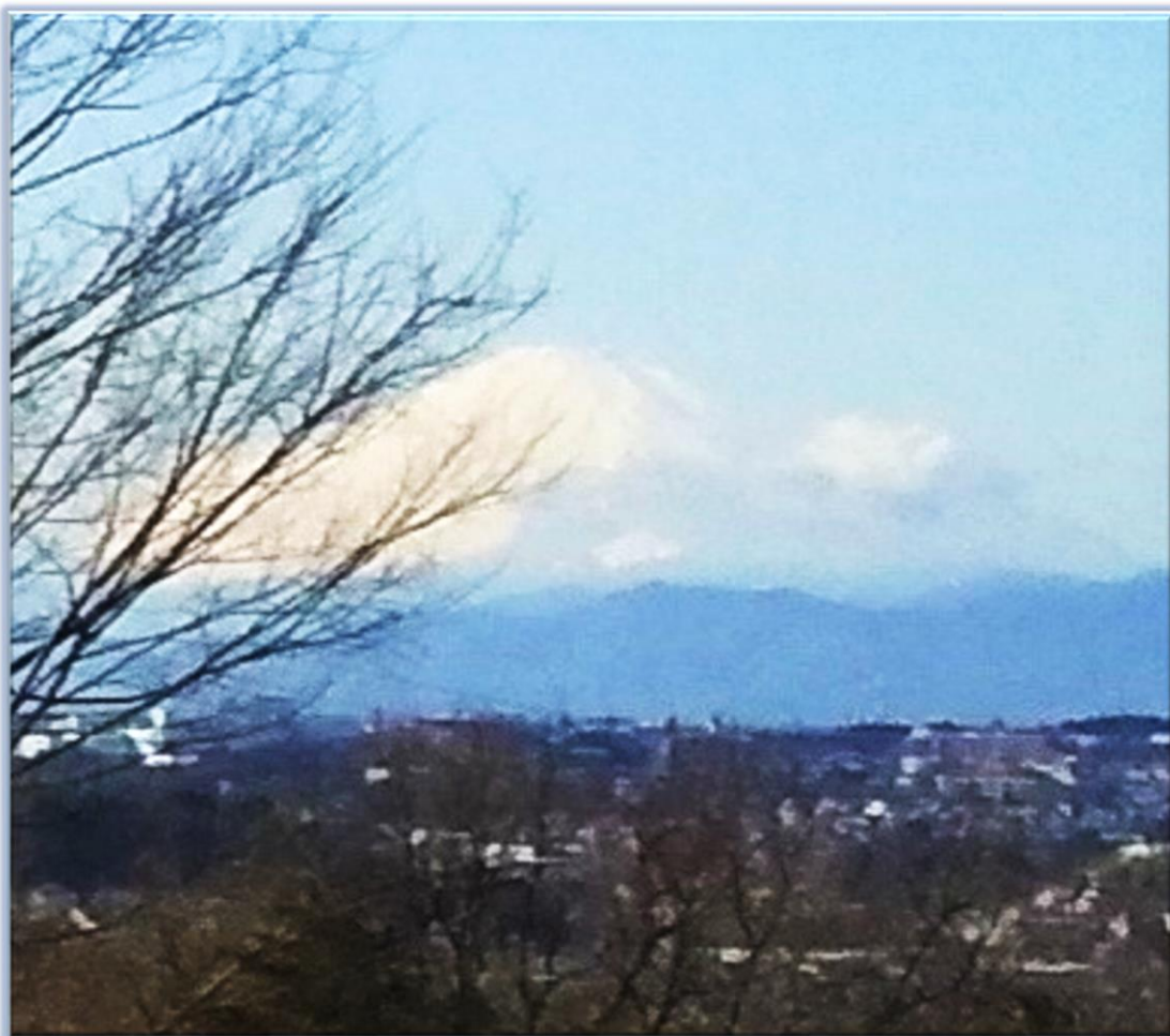
当所から望む積雪の富士山