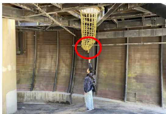
事故と同種のネット（袋状の下部が破れた）