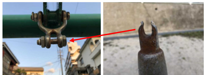
摩耗により上部がすり減り破断した吊り金具の状況（右写真）