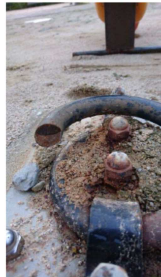
根本破断状況（拡大）