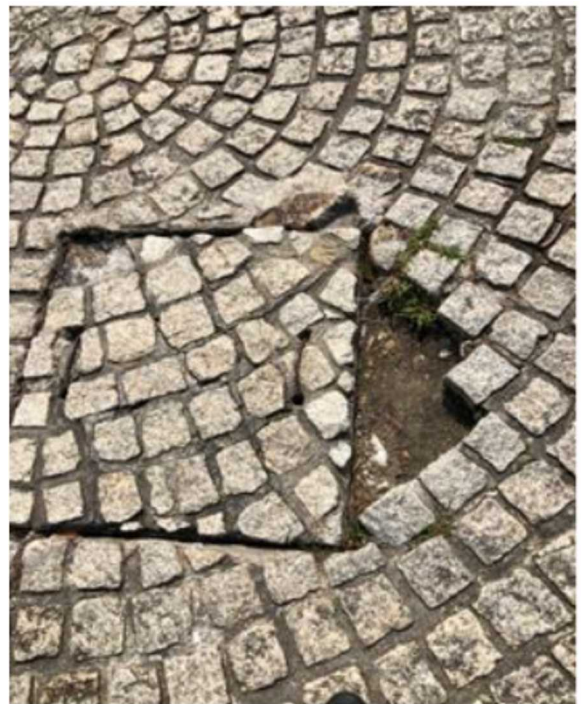
原因となったブロックが取れたくぼみ