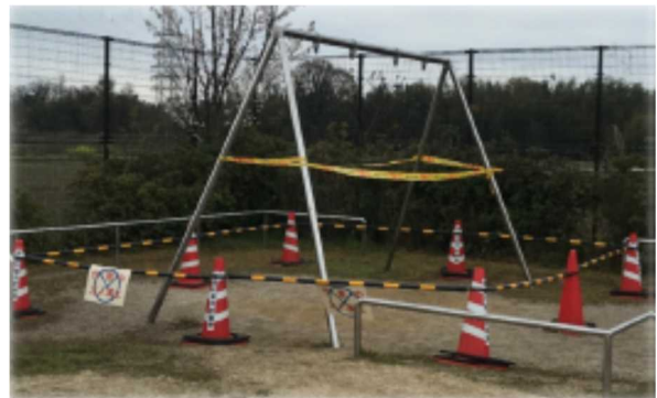
遊具使用禁止措置状況