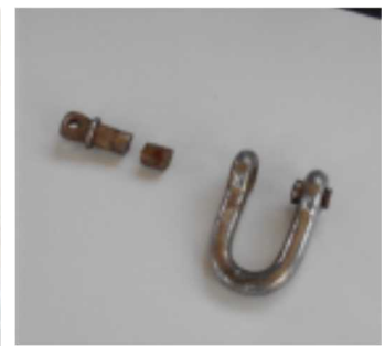
吊り金具破損部詳細