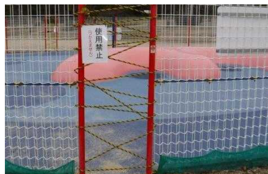
立入禁止措置状況