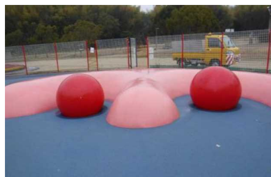
ボール（φ850）設置時の状況