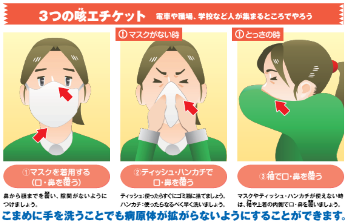
図3 咳エチケットについて