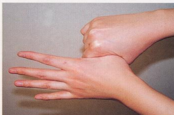
5. 親指と手掌をねじり洗いする